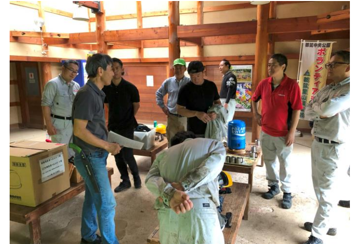
体験終了後の振返り・質疑応答 10