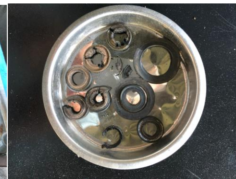
劣化したパッキン