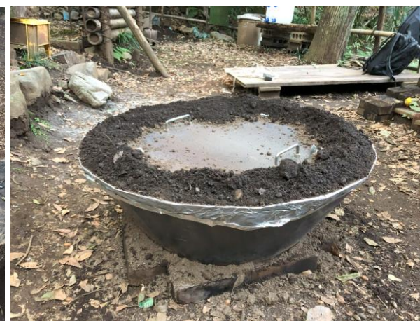
燃焼後上蓋・土留めして密封・自然放置で冷却