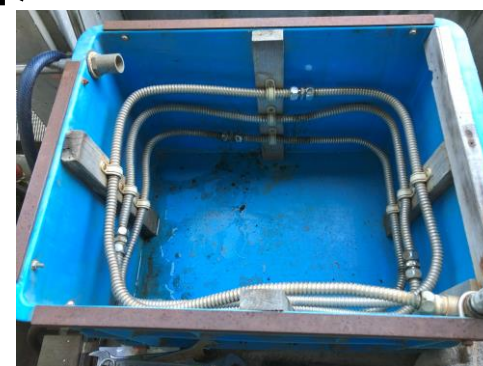
竹酢液蒸留装置／冷却管