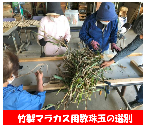
竹製マラカス用数珠玉の選別