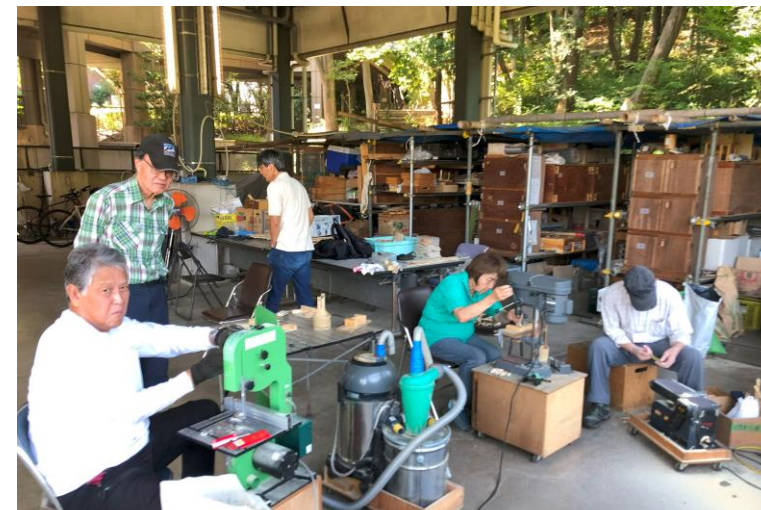
竹細工工房展開中