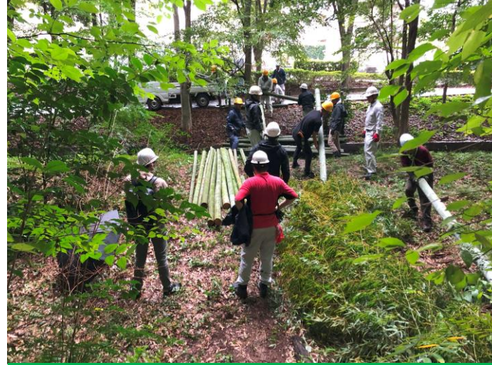
搬送とトラックへの積み込み