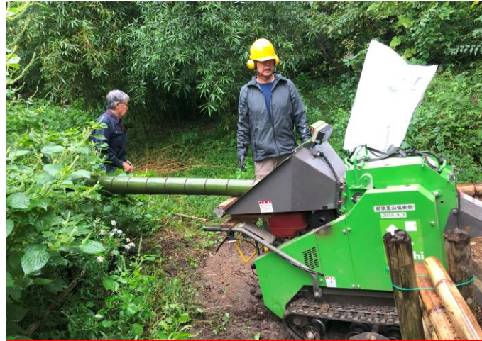
炭焼き部会 千本処理の見学