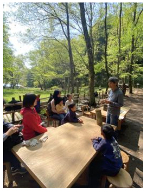
筍ってどんな風に生えるかな？