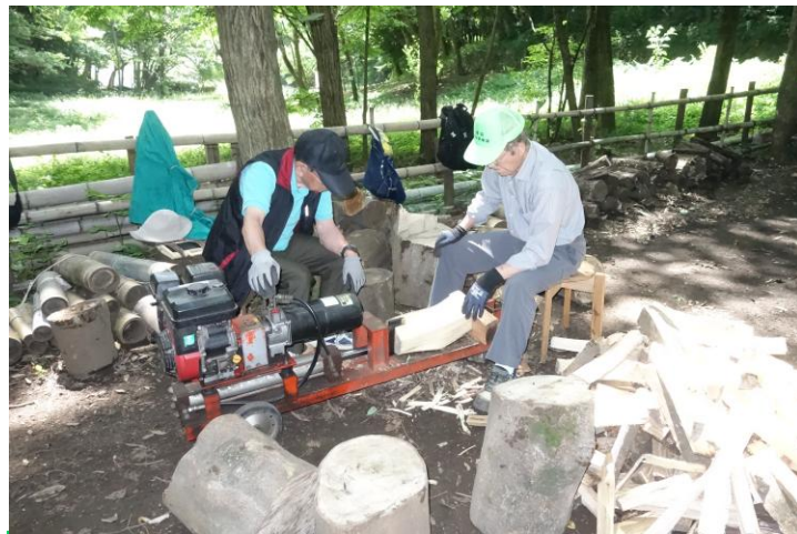
炭焼きの合間に 火入れ燃料の薪割り