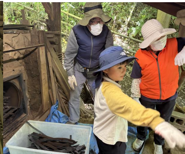
一般体験プログラムに親子で参加、お手伝い 作業前にマスクして… 製品の取出し