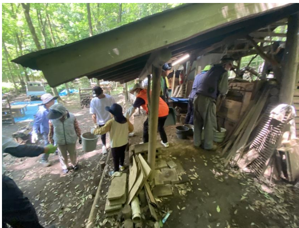
土留め撤去／バケツリレーで！