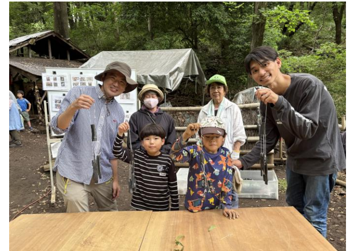
特別体験プログラム 竹炭風鈴の完成