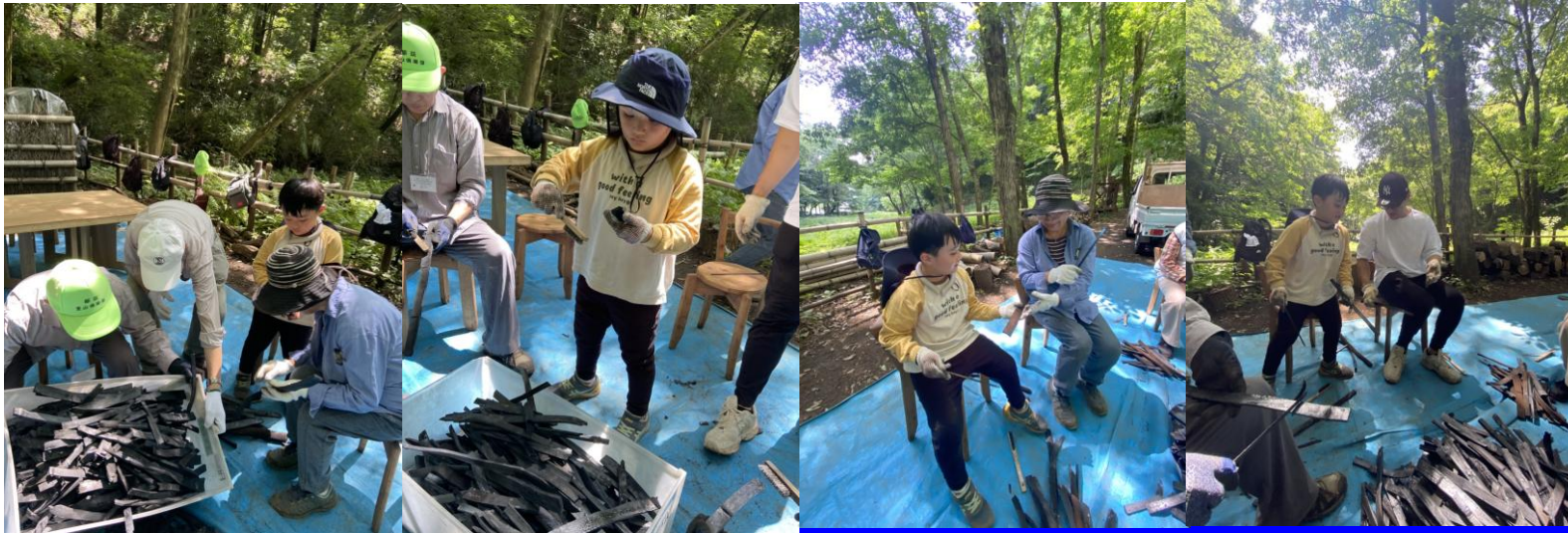
良質の炭の選別／キンキン♪ & 研磨