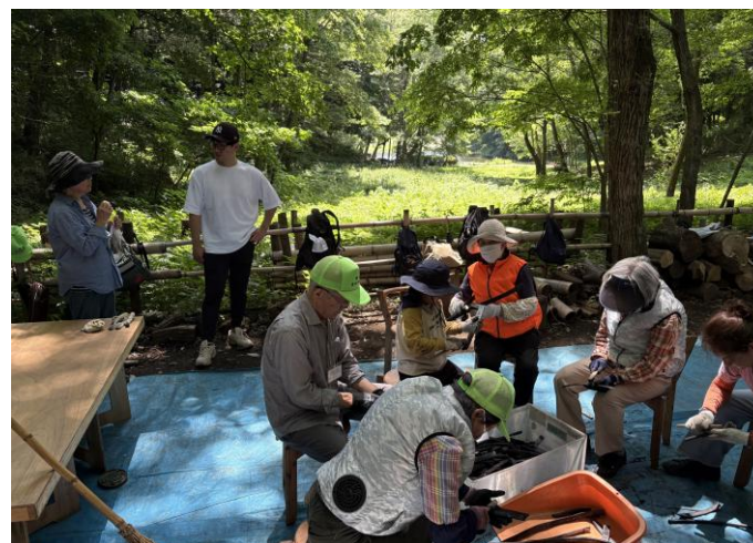
猛暑でも炭焼き窯の敷地内は木陰で涼しい！？