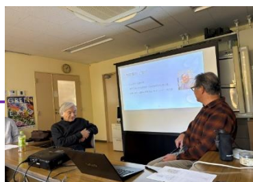
永田先生と司会者