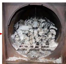
窯出し前(火入れ後)

新年度最初の炭焼きは、たたら製鉄の燃料用として先々月から3回連続で木炭を焼きました。これで在庫量として通算85 kgとなり、目標とした60 kgを達成しました。今月のボランティア体験応募者は1名。窯詰め、窯出しの体験をしていただきました。都合で参加できなかった火入れ体験は5月に参加の予定。他に、スポット参加希望者1名を受入れ、窯出しなどの作業と一緒にさせていただきました。