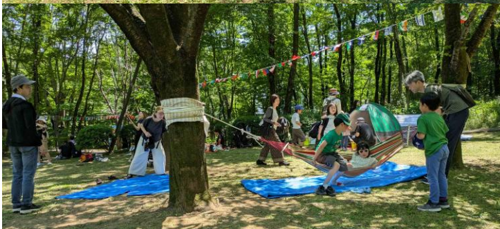
竹ピラミッド&ロープブリッジ