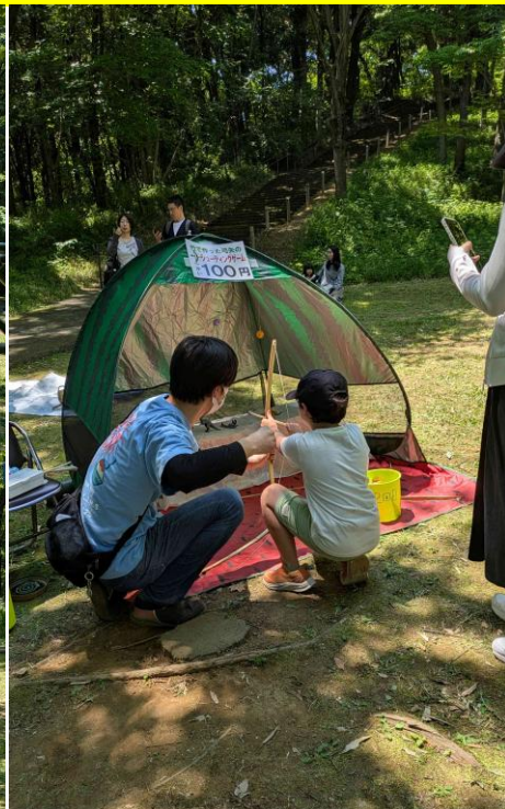
弓矢で怪獣を射る