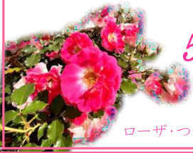
ローザ・つづきく